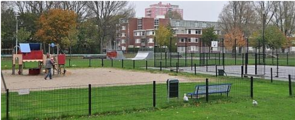
Deel van Richard Krajicek Playground

Op de Playground is een speelterrein met diverse sport- en spelmaterialen, het zogenaamde ' Haagse Hopje ', waar onder andere voetbal-, basketbal-, tennis- en skate benodigdheden geleend kunnen worden. Er is toezicht op de Playground. Verder kunnen wij uitwijken naar het park/ recreatiegebied 'de Uithof' en eens in de zoveel tijd uitjes ondernemen naar bijvoorbeeld Avonturia de Vogelkelder, wat eveneens dicht in de buurt is. Zowel binnen ons pand als buiten ons pand zal altijd toezicht en begeleiding zijn van pedagogisch medewerkers met eventueel ondersteuning van stagiaires.