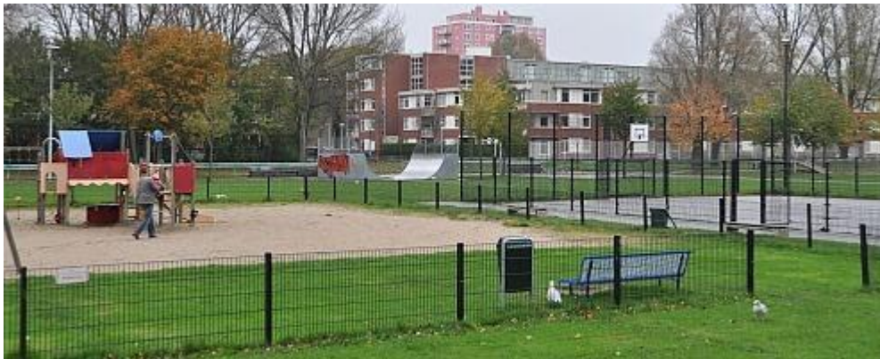
Deel van Richard Krajicek Playground

Op de Playground is een speelterrein met diverse sport- en spelmaterialen, het zogenaamde ' Haagse Hopje ', waar onder andere voetbal-, basketbal-, tennis- en skate benodigdheden geleend kunnen worden. Er is toezicht op de Playground. Verder kunnen wij uitwijken naar het park/ recreatiegebied 'de Uithof' en eens in de zoveel tijd uitjes ondernemen naar bijvoorbeeld Avonturia de Vogelkelder, wat eveneens dicht in de buurt is. Zowel binnen ons pand als buiten ons pand zal altijd toezicht en begeleiding zijn van pedagogisch medewerkers met eventueel ondersteuning van stagiaires.